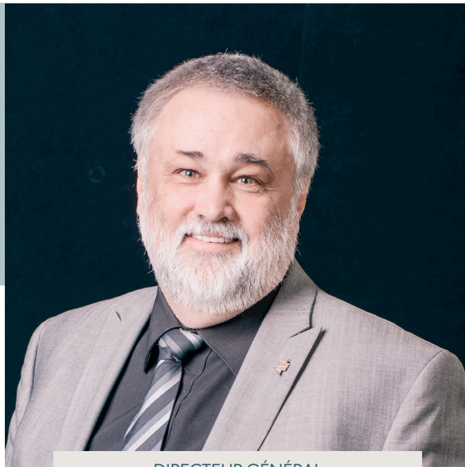
DIRECTEUR GÉNÉRAL CÉGEP DE L'ABITIBI-TÉMISCAMINGUE

La Fondation du Cégep de l'Abitibi-Témiscamingue est un précieux allié du Cégep. Elle nous permet de nous élever, de rêver et d'encourager les étudiantes et les étudiants à se réaliser. Elle joue un rôle de premier plan pour le soutien des programmes d'études et de la réussite scolaire, pour la persévérance, pour l'amélioration de la qualité de vie étudiante ainsi que pour le développement du sport collégial et des activités socioculturelles.